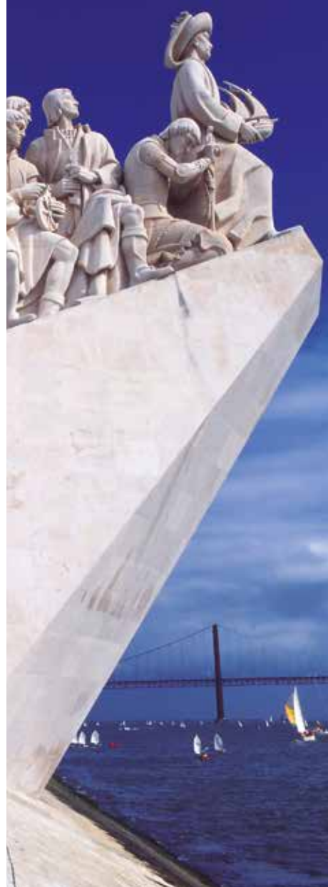
Monumento aos Descobrimentos - Lisboa

CASO TENHA INTERESSE NESTA VIAGEM, CONTACTE O SEU AGENTE DE VIAGENS.