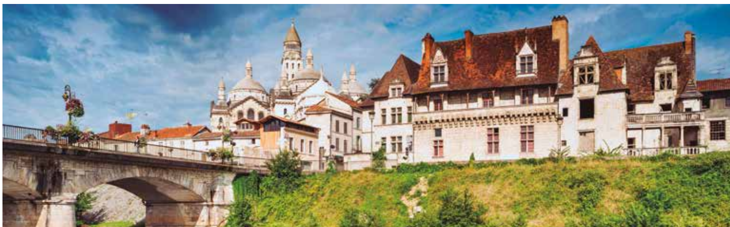
Santiago de Compostela

Após o café da manhã CONTINENTAL no Tour Classic e BUFÊ no Tour Premium, traslado SEM ASSISTENTE do Hotel até o aeroporto de Porto INCLUSO. NOTA IMPORTANTE: O Guia Brasileiro NÃO acompanha os passageiros no traslado de saída até o aeroporto. Como há muitos voos e conexões diferentes para a saída da Europa, é possível que o Guia Brasileiro não permaneça na cidade, neste dia, até que o último passageiro embarque de volta ao Brasil. Em todo o caso, o Guia Brasileiro dará previamente todas as informações aos passageiros sobre o traslado de saída.